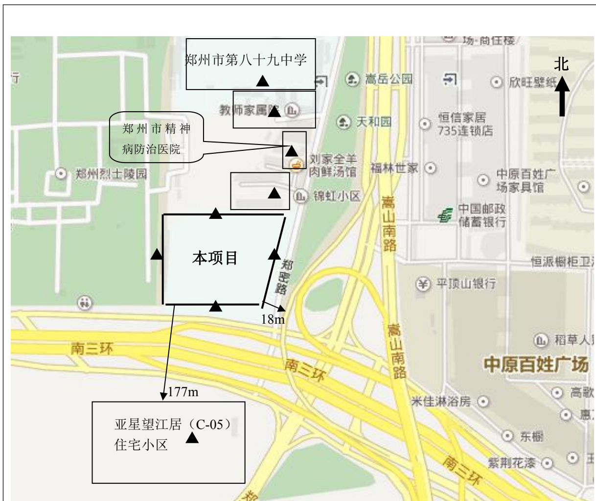
图 1 项目周围环境概况 ▲：噪声监测点位